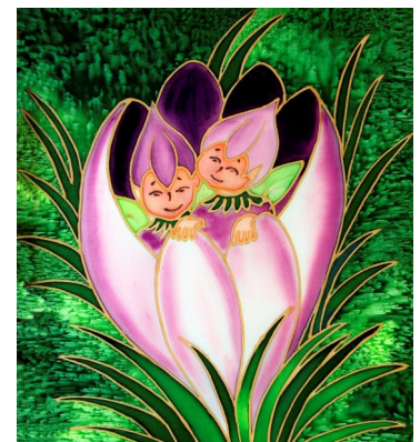
Forside billede af Kirsten Seeberg.